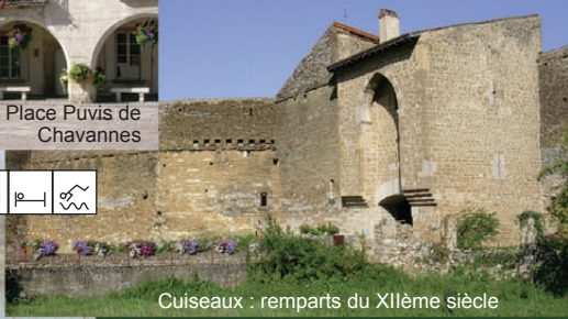
Cuiseaux : remparts du XIIème siècle