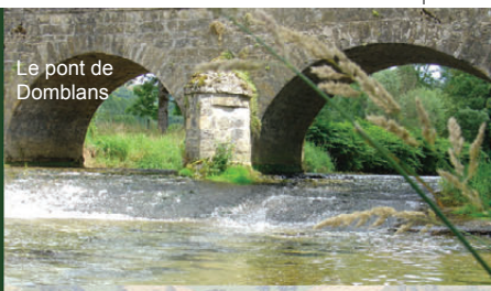
Le pont de Domblans