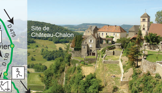
Site de Château-Chalon