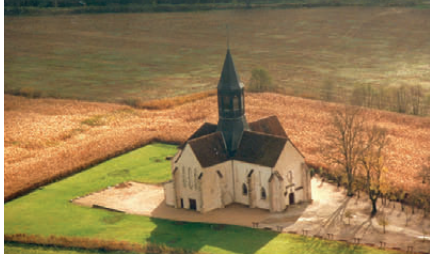
Tuilerie de Varennes