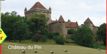
Château du Pin